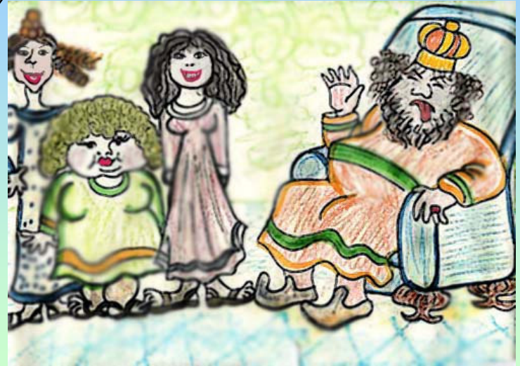
נוצר על-ידי לאה.ס.

אֶת אֶסְתֵּר הַיְּפָה לָקַח לוֹ לְאִשָּׁה וְכִתֵּר מַלְכוּת נָתַן בְּרֵאשִׁיָּה.