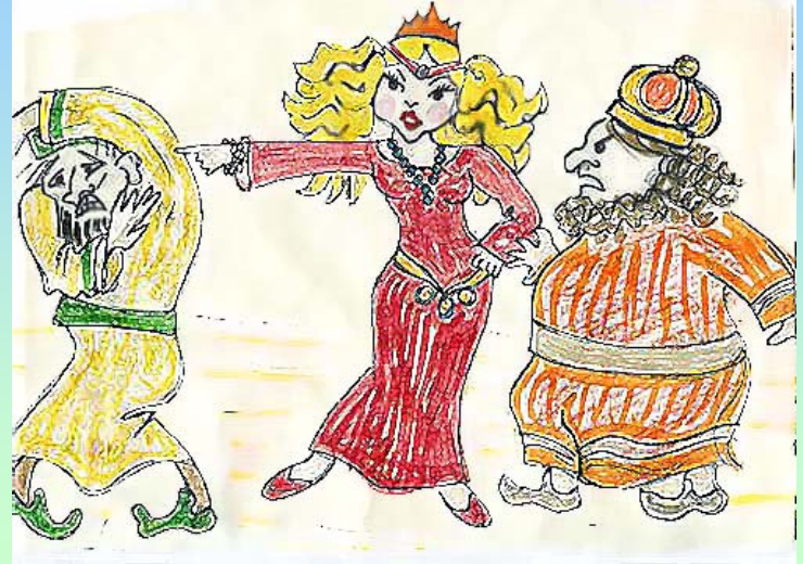
נוצר על-ידי לאה.ס.

הַצִּיל אֶז הִי אֶת-עֲמוֹ מִצָּרָה, תָּלוּ עַל הָעֵץ אֶת הַמֶּן הַרְשָׁע. הִיָּתָה לְיְהוּדִים אֶז שְׂמִיחָה גְדוֹלָה, כֹּל-זֶה מְסַפֵּר כֹּה יָפָה בַּמְּגִלָּה.