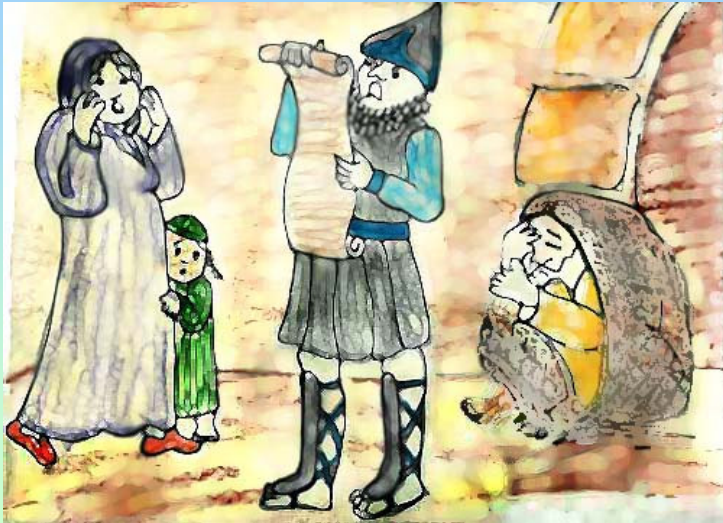
נוצר על-ידי לאה.ס.

נִפְל הַפּוֹר, וּפְרָסִים בְּרַבִּים, יְהִי מֵר וְאַכְזָר גּוֹרֵל הַיְהוּדִים.