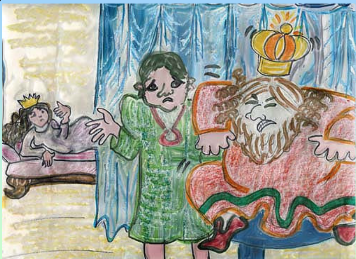
נוצר על-ידי לאה.ס.

הַמֶּלֶךְ עָשָׂה מִשְׁתֶּה לְאֲנָשֵׁי מַמְלַכְתּוֹ אֵךְ וְשֵׁתִי הַמֶּלֶכָּה סָרְבָה לָבוֹא אֲחֻשׁוּרוֹשׁ הָיָה מֶלֶךְ מִדֵּי וּפָרַס אֶת אִשְׁתּוֹ גֵּרֶשׁ, כִּי עָלְיָה כָּעַס