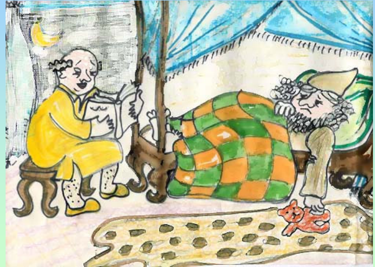
נוצר על-ידי לאה.ס.

אֶת מְרֻדְכֵי הַרְכִּיבוּ עַל סוּס אַבִּיר וְהָמוֹן הַכְּרִיז בְּכָל הָעִיר: "כָּכָה יַעֲשֶׂה לְאִישׁ אֲשֶׁר הִמְלִיךְ חֶפֶץ בִּיקָרוֹ"