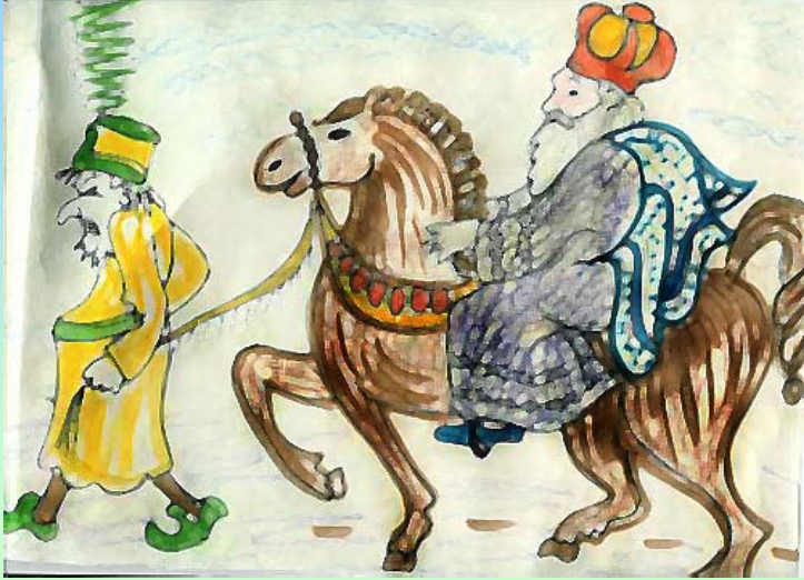
נוצר על-ידי לאה.ס.

אֶת מְרֻדְכֵי הַרְכִּיבוּ עַל סוּס אַבִּיר וְהָמוֹן הַכְּרִיז בְּכָל הָעִיר: "כָּכָה יַעֲשֶׂה לְאִישׁ אֲשֶׁר הִמְלִיךְ חֶפֶץ בִּיקָרוֹ"