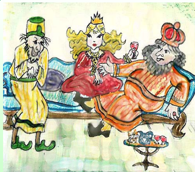
נוצר על-ידי לאה.ס.

הַמֶּלֶךְ עָשָׂה מִשְׁתֶּה לְאֲנָשֵׁי מַמְלַכְתּוֹ אֵךְ וְשֵׁתִי הַמֶּלֶכָּה סָרְבָה לָבוֹא אֲחֻשׁוּרוֹשׁ הָיָה מֶלֶךְ מִדֵּי וּפָרַס אֶת אִשְׁתּוֹ גֵּרֶשׁ, כִּי עָלְיָה כָּעַס