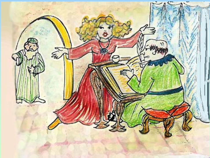
נוצר על-ידי לאה.ס.

אַסְתֵּר מִהֲרָה אֶת הַמְּקָרָה לְסַפֵּר וְלִרְשׁוֹם הַדְּבָרִים עַל-יְדֵי הַסּוֹפֵר