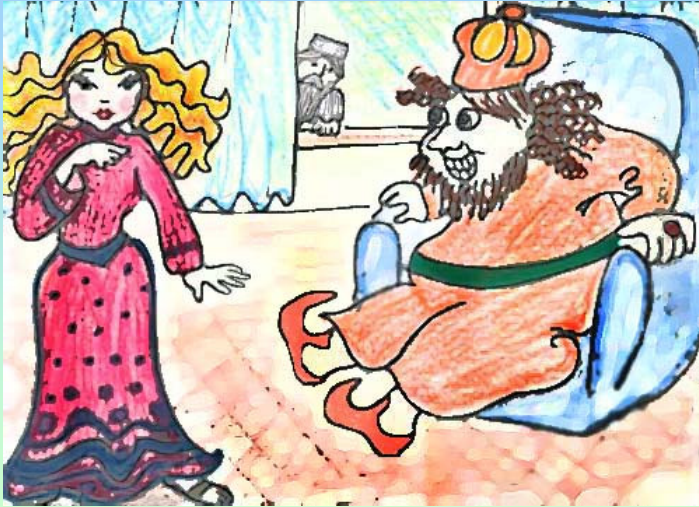
נוצר על-ידי לאה.ס.

אֶת אֶסְתֵּר הַיְּפָה לָקַח לוֹ לְאִשָּׁה וְכִתֵּר מַלְכוּת נָתַן בְּרֵאשִׁיָּה.